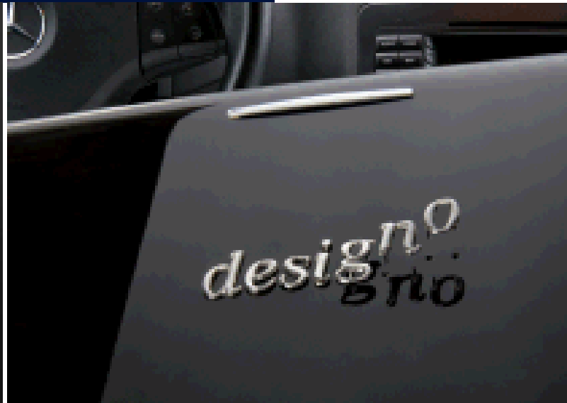
Feine Metall-Designs mit klugen Befestigungslösungen. Variata fertigt 3D Zierteile und Embleme mit Befestigungslösungen, so schön wie technisch perfekt, ganz abgestimmt auf Vorgaben für Fahrzeug In- und Exterieur.

Möglich macht dies die hauseigene Entwicklung und hohe Fertigungstiefe auf modernstem technischen Niveau: vom Formen- und Modellbau über die Gießerei und Galvanik bis hin zur Veredelung. Und nicht zuletzt ist es das rund 50-köpfige variata Team, für das der Leitspruch „Metall - wir leben es“ Tag für Tag Ansporn für präzise, kreative und absolut kundenorientierte Leistung ist.