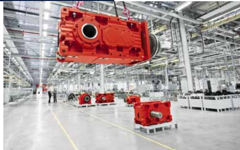
Im neuen Getriebewerk werden die ganz großen Antriebslösungen gefertigt.